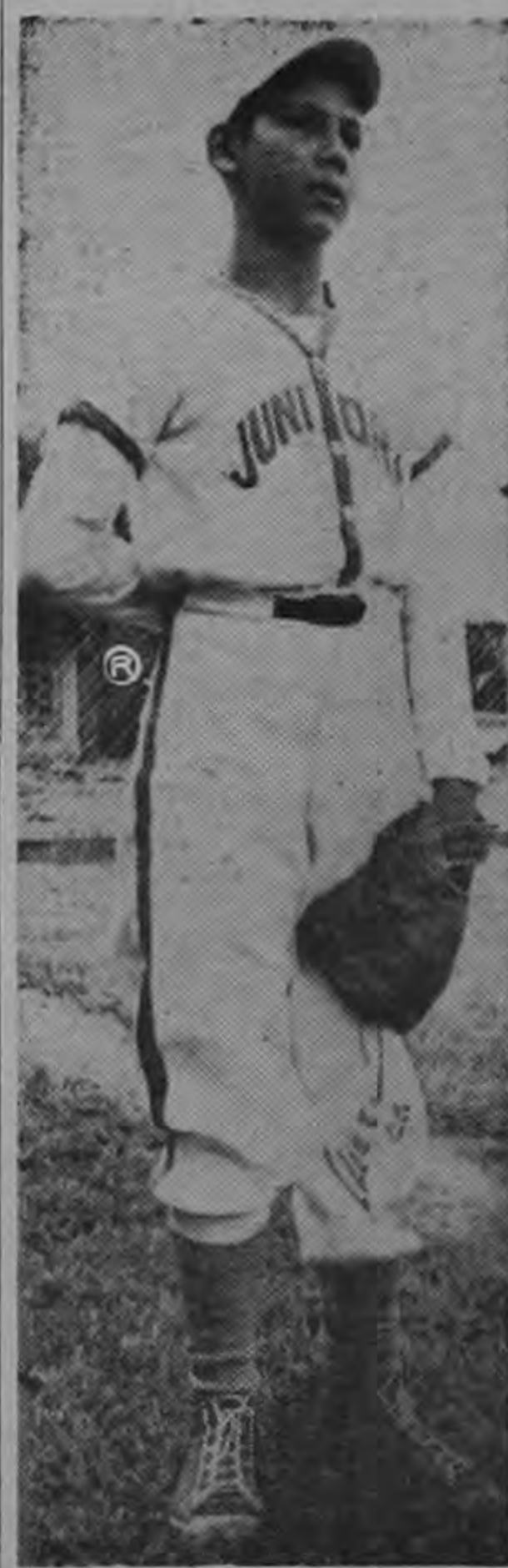
Seguindo nuestras entrevistas semanales a los peloteros de las

Y con un apretón de manos con este optimista pelotero terminó la entrevista de esta semana.