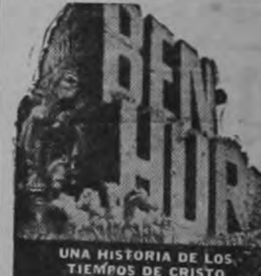
TECHNICOLOR® FILMADA EN CÁMARA 65

HOY MARTES 17 DE OCTUBRE 1961 ¡Últimas semanas! ¡Últimas exhibiciones! ¡Se va el titán religioso que ha mantenido abarrotada la taquilla durante tres meses! VARIEDADES 2 y 7 ..... ¢ 5.00