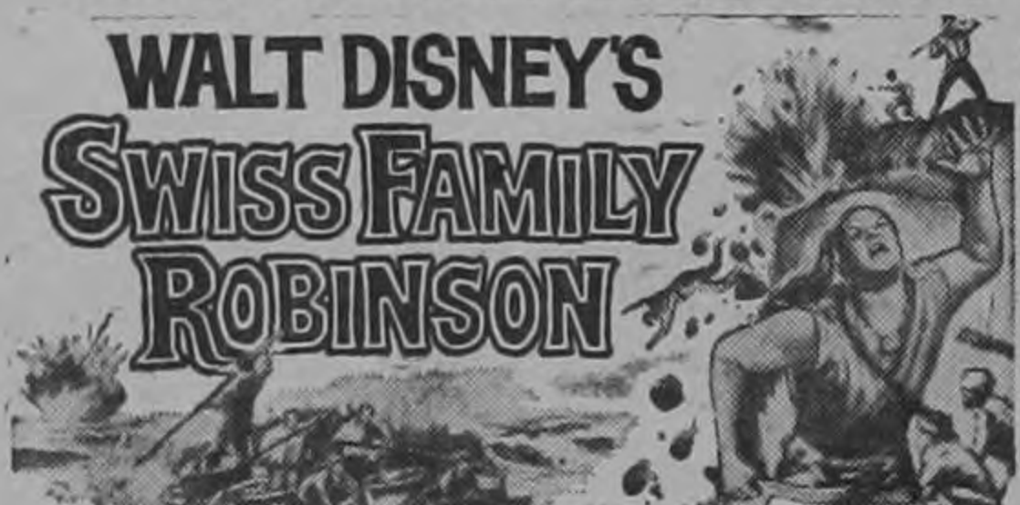
STARRING JOHN DOROTHY JAMES JANET MILLS-McGUIRE MacARTHUR MUNRO HAYAKAWA KIRK CONCORDAN PARKER HO-REID TAYLOR TECHNICOLOR FILM IN PANAVISION ©Walt Disney Production RELEASED BY BUENA VISTA DISTRIBUTION CO., INC.