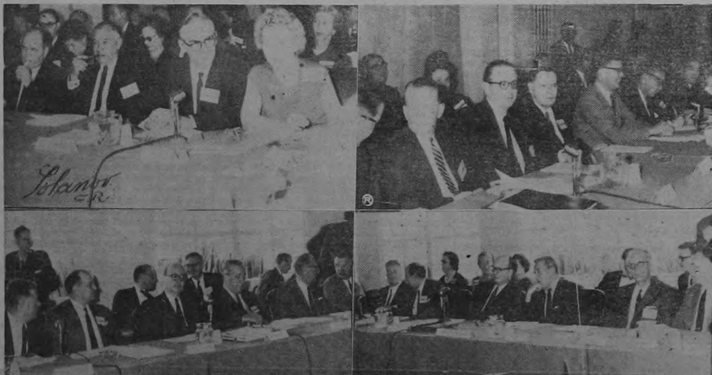
Ayer a las nueve de la mañana, en el Hotel Costa Rica, se dio inicio a la anunciada reunión de Em-